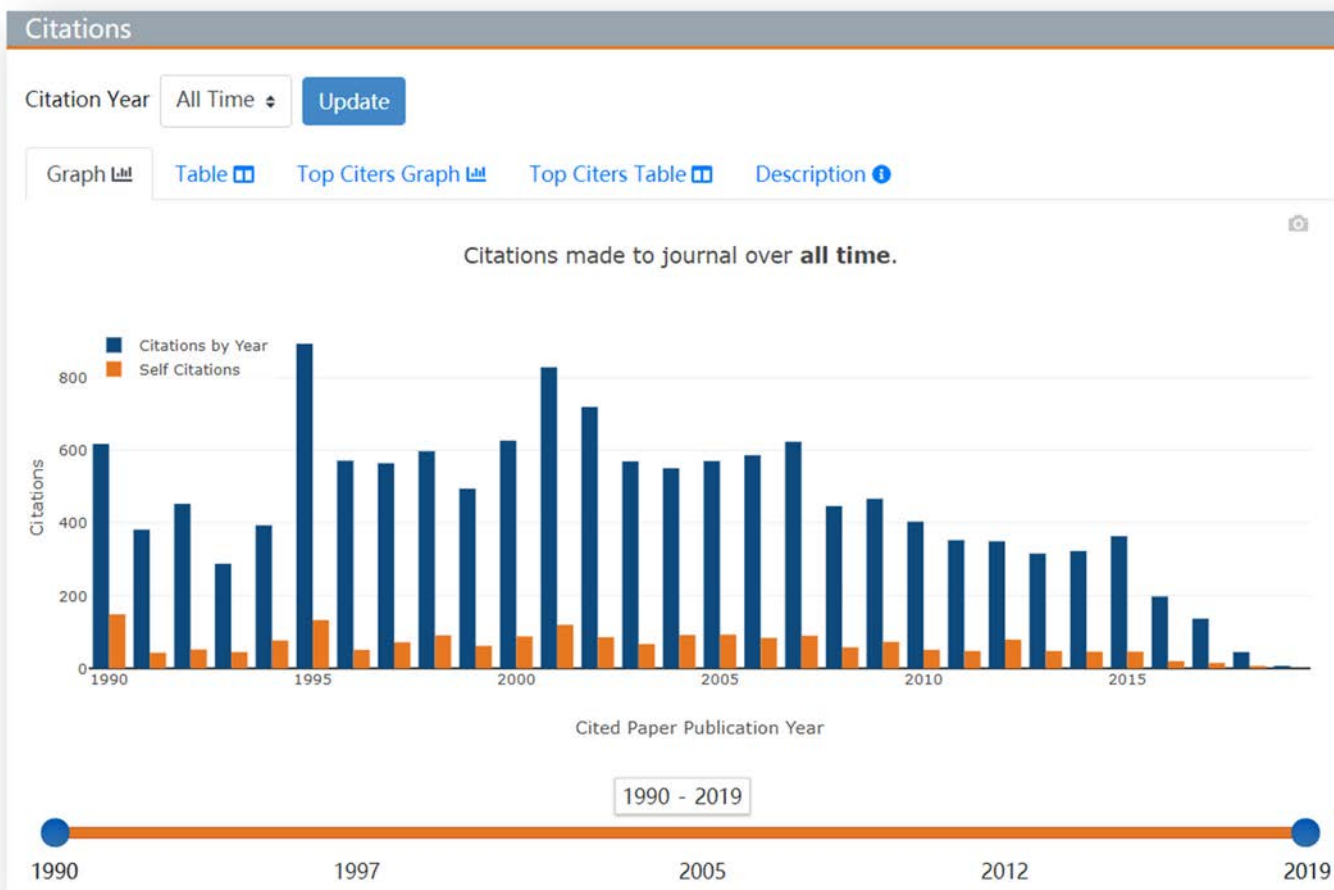
图 4—该刊被引次数的年限分布 (可选择全部时间或施引年份)