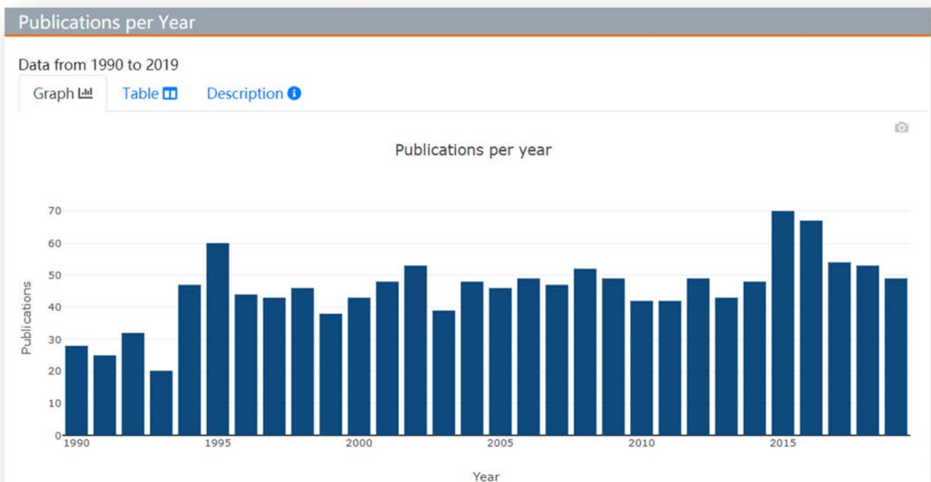
图 5—该刊近年的年发文量