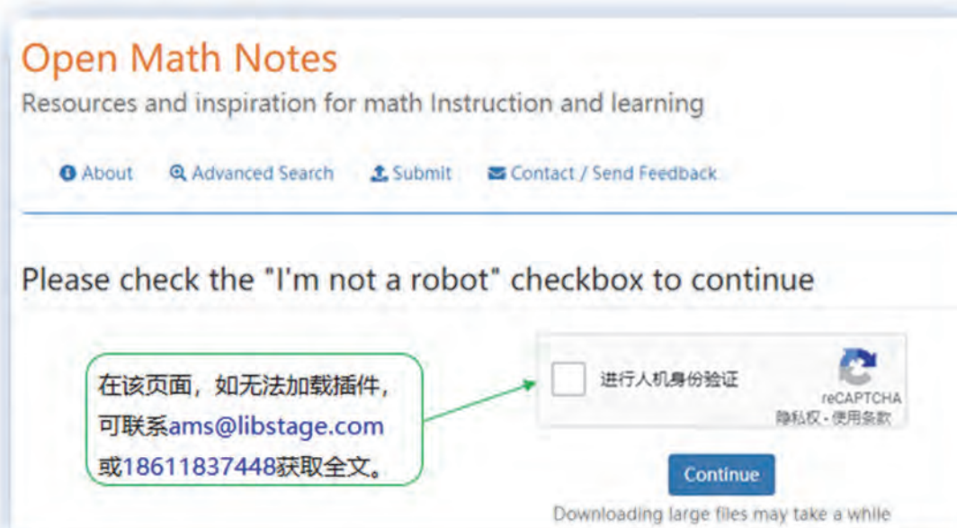
图 3: Open Math Notes 资料下载校验页